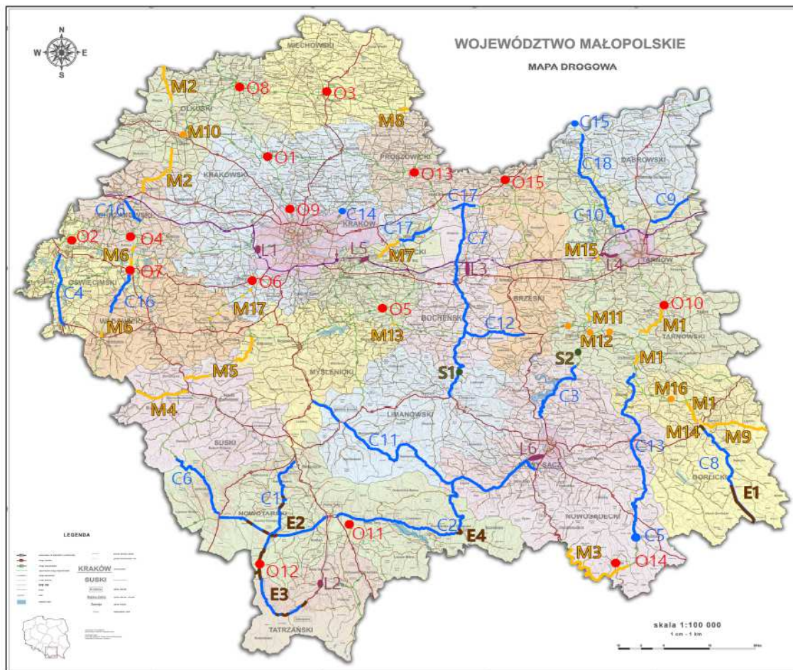
Rys. 2. Planowane inwestycje drogowe w Małopolsce do roku 2023