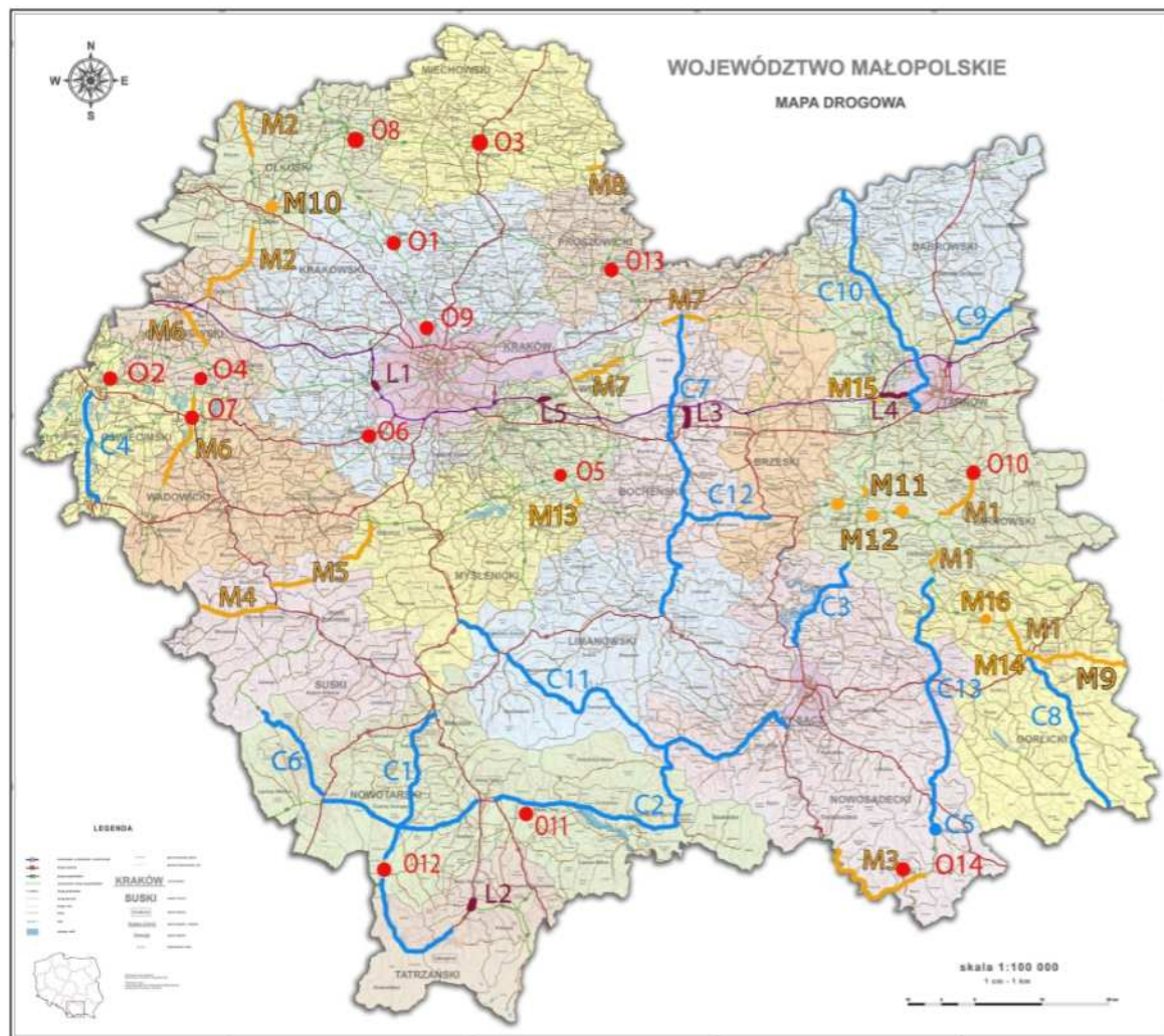
Rys. 2. Planowane inwestycje drogowe w Małopolsce do roku 2023