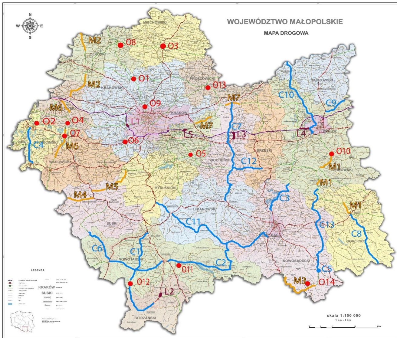
Rys. 2. Planowane inwestycje drogowe w Małopolsce do roku 2023